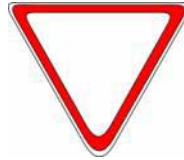
"CEDA EL PASO"