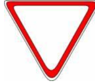
"CEDA EL PASO"